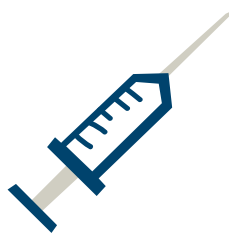
Planes públicos de salud, como vacunas, educación sexual y reproductiva, y alimentación complementaria