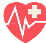
Urgencias, independiente de su situación migratoria y laboral